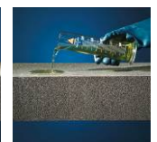
Säure- und chemikalienbeständig