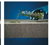
Säure- und chemikalienbeständig